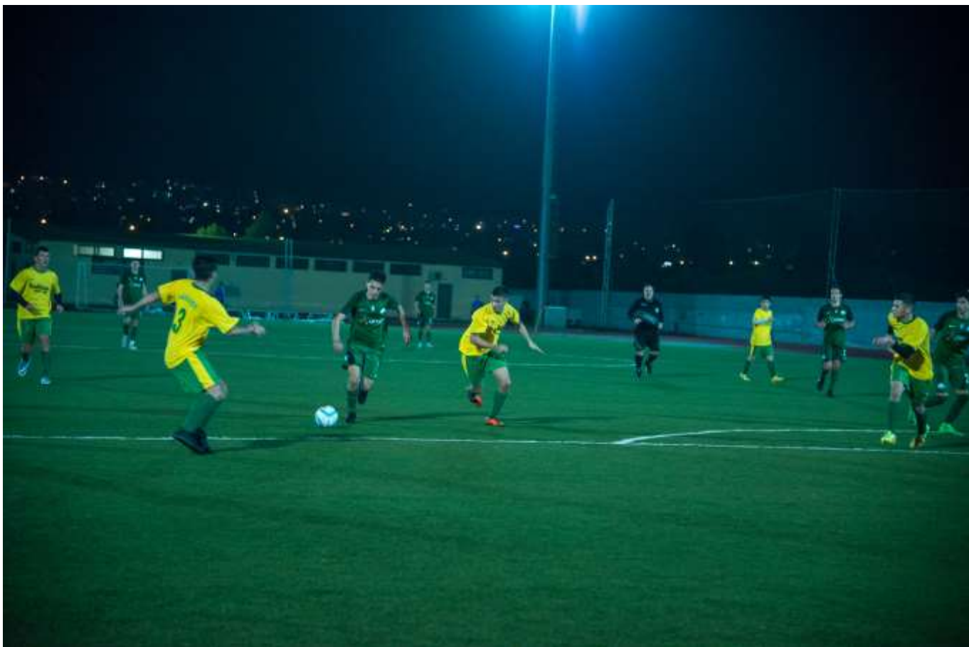
Στιγμιότυπο από τον αγώνα Νέοι Παναθηναϊκού – Επίλεκτοι Ιλίου